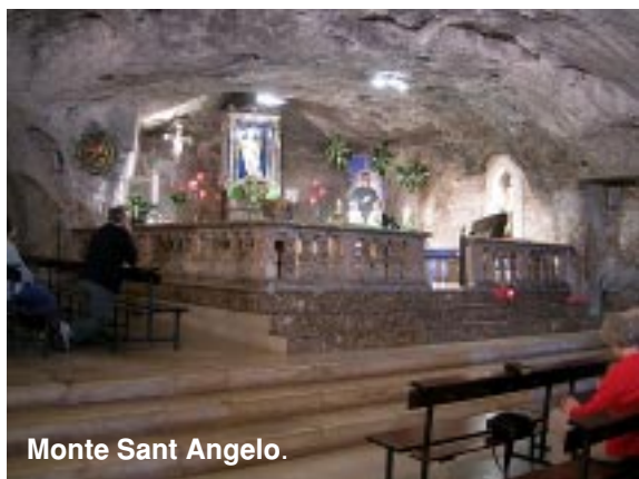
Monte Sant Angelo.

która była dla nas niezapomnianym przeżyciem oraz zwiedziliśmy Panteon, Kapitol, Forum Romanum, Koloseum, Plac Wenecki, Fontannę Di Trevi oraz Plac Hiszpański. Ostatni dzień pobytu w Rzymie spędziliśmy zwiedzając Katakumby oraz Bazylikę św. Pawła za Murami.