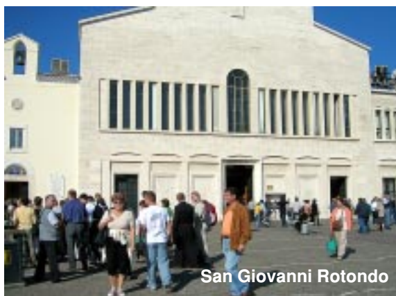
San Giovanni Rotondo