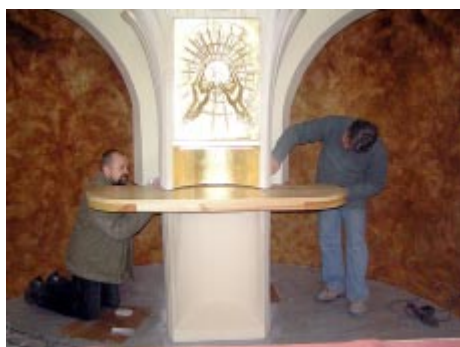
montaż osłony pod tabernakulum,