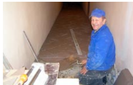
kafelkowanie posadzki w piwnicy plebanii,