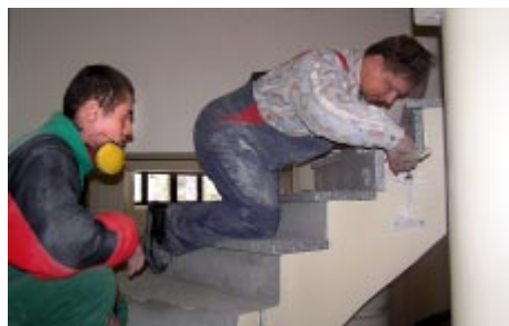
wykładanie kamieniem schodów na chór,

Od początku roku prowadzone były następujące prace: