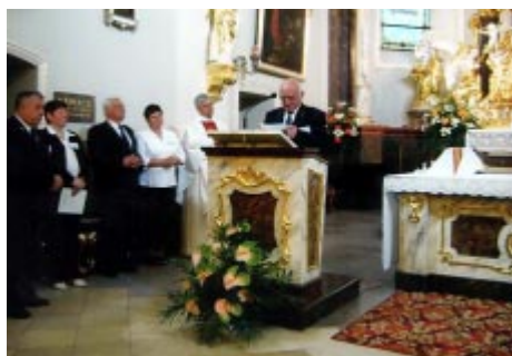
Góra św. Anny